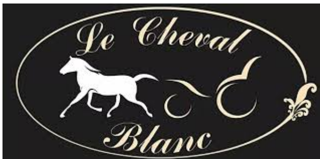
Le Cheval Blanc à Vézelay