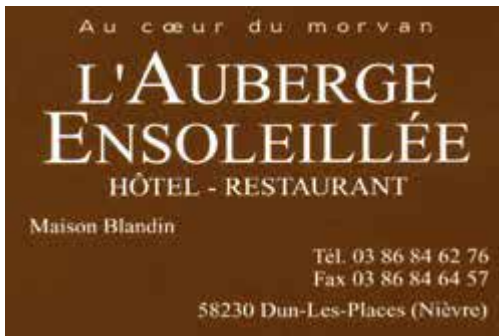
L'Auberge Ensoleillée à Dun – Morvan