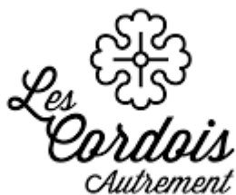
Les Cordois à Avallon (4km) Sélection MICHELIN