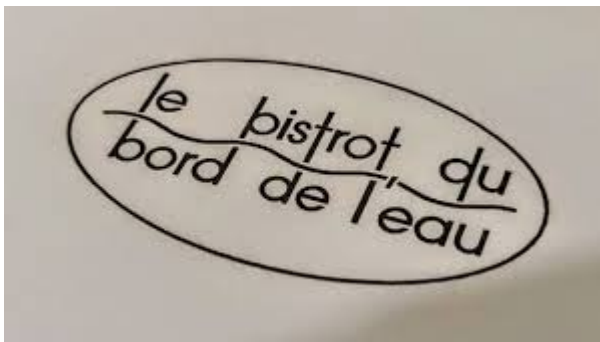
Bistrot du Restaurant gastronomique Levernois