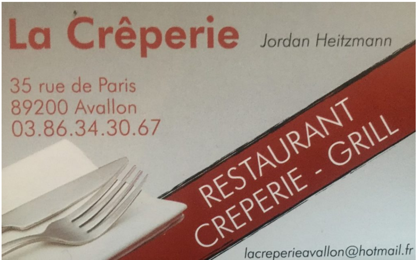
La Crêperie à Avallon