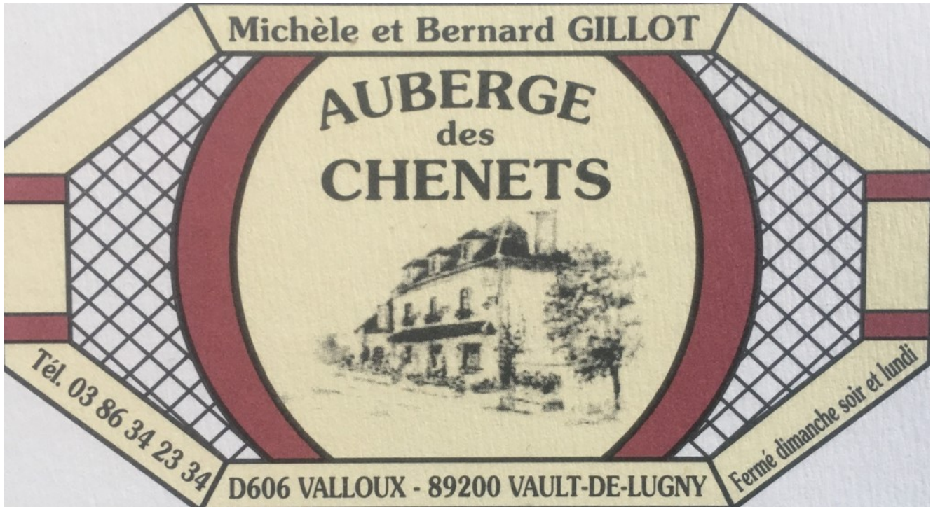
L'Auberge des Chenêts – VALLOUX Sélection BiB MICHELIN