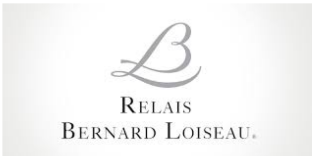
Bernard Loiseau à Saulieu – 2 macarons Michelin