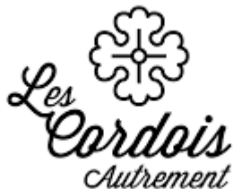
Les Cordois à Avallon (4km) Sélection MICHELIN