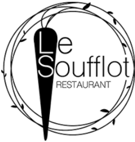
Le Soufflot à Irancy – Restaurant Bar à Vin