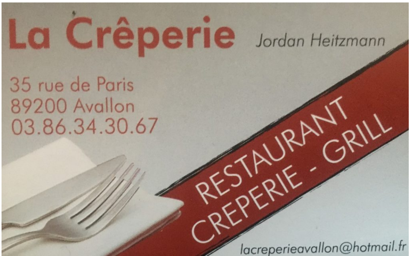
La Crêperie à Avallon