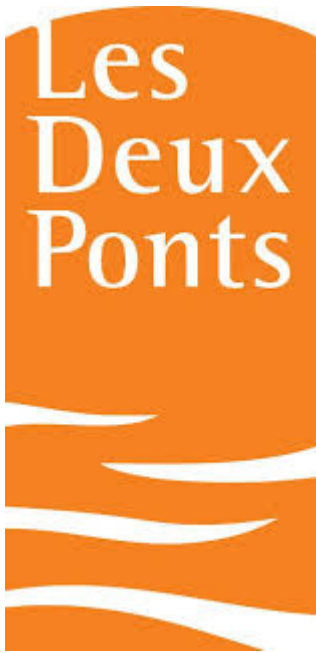
Les Deux Ponts à Pierre-Perthuis (Vézelay)