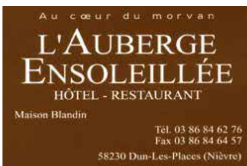
L'Auberge Ensoleillée à Dun – Morvan