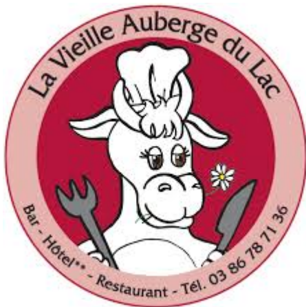
La Vieille Auberge à Saint-Agnan – Morvan