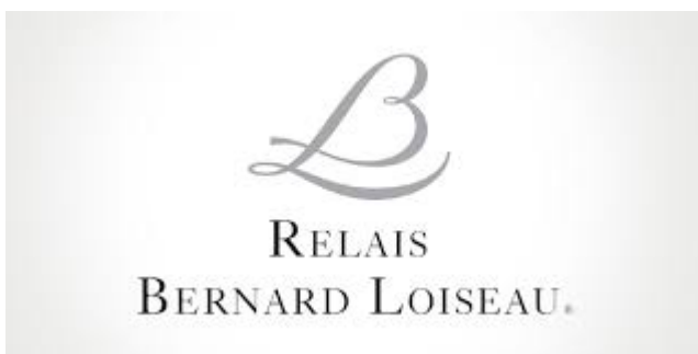
Bernard Loiseau à Saulieu – 2 macarons Michelin