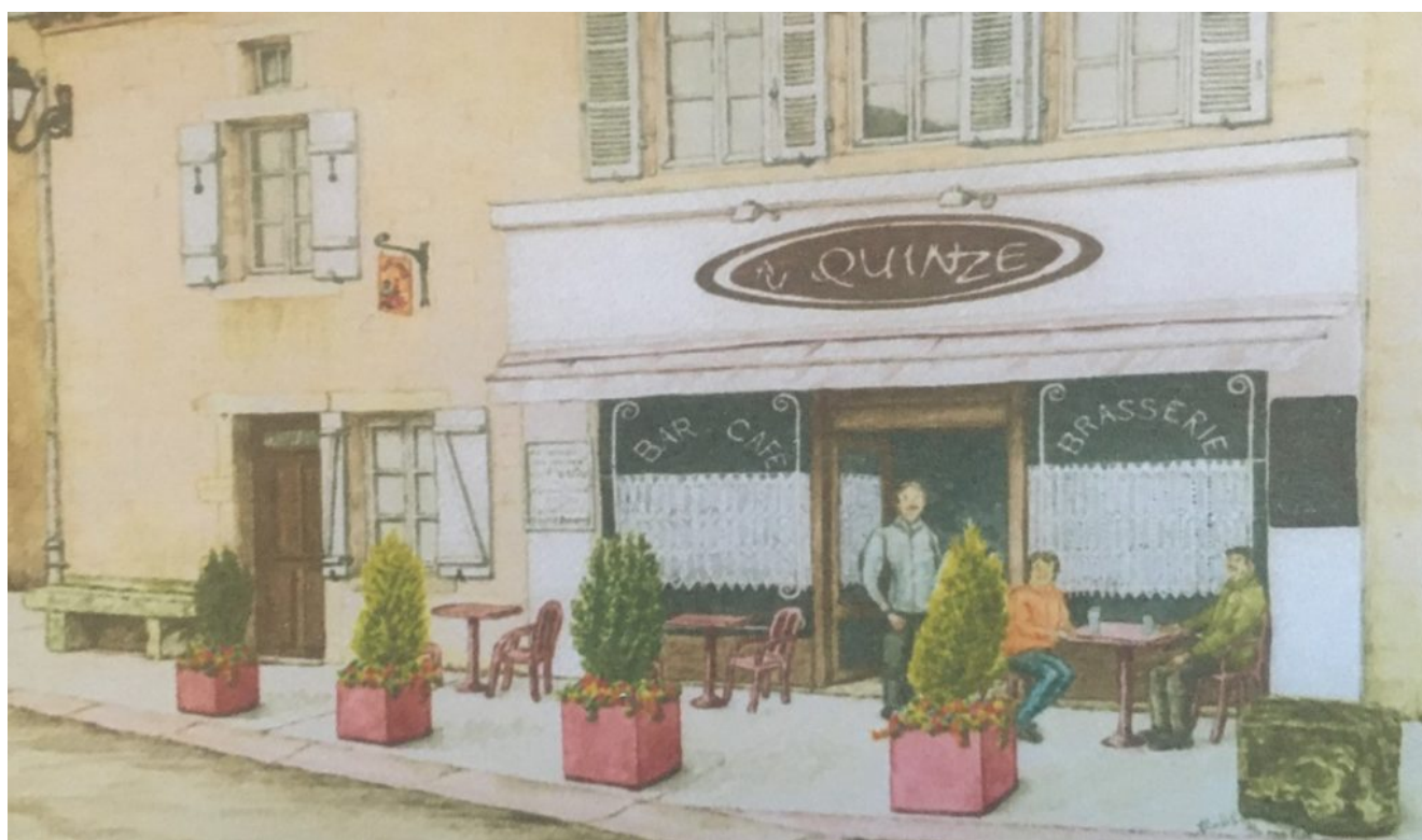
Au Quinze à Montréal