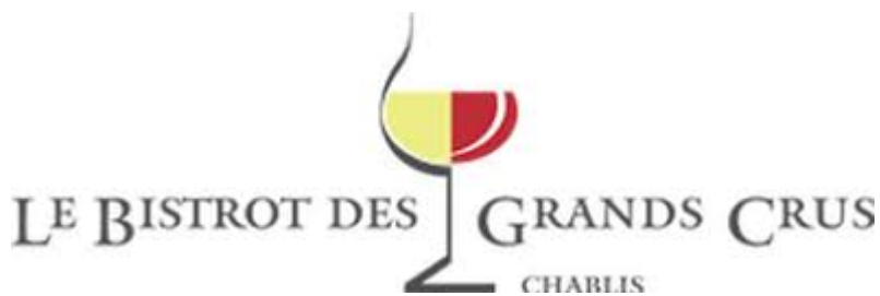
Le Bistrot des Grands Crus à Chablis