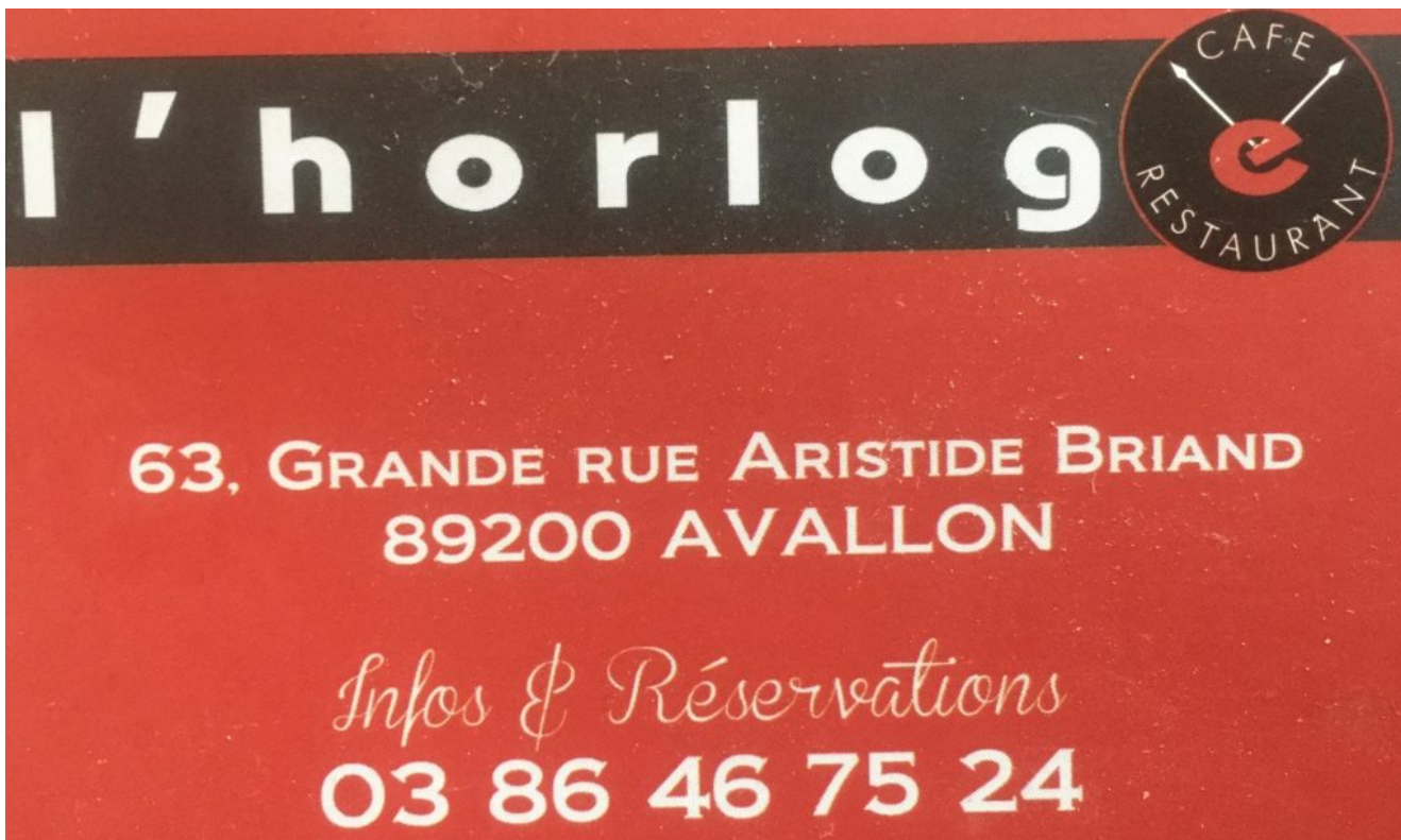
L'Horloge à Avallon – Bistrot Terrasse